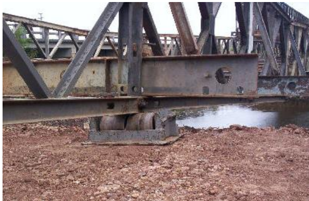
Puente de elementos de acero, nótese que presenta un descanso intermedio de rodillo.

Las tuberías de vapor largas tienen juntas de expansión o secciones con forma de U para evitar que se pandeen o estiren al cambiar la temperatura. Si un extremo de un puente de acero está fijo rígidamente a su estribo, el otro por lo regular descansa en rodillos.