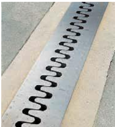
Los dientes de una articulación de expansión de un puente. Se requieren estas articulaciones para dar cabida a los cambios de longitud resultado de la expansión térmica.